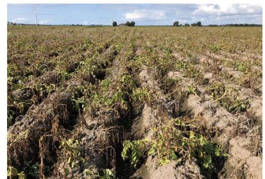
Loofdoding in aardappel