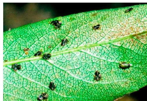
Perenbladvlo in peer