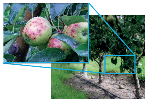
Vruchtschade boven de zwarte grond