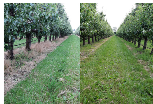
Halve dosering Kyleo: links met, rechts zonder Squall